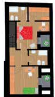
Pianta piano secondo