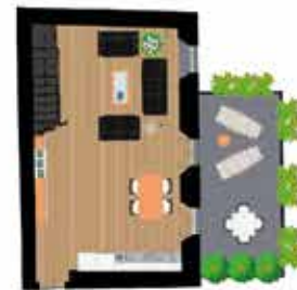
Pianta piano primo