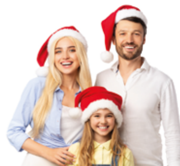
Foto: Shutterstock / iStockphoto.com Immagine: Shutterstock / iStockphoto.com Immagine: Shutterstock / iStockphoto.com

PRENOTA IL TUO CONSULTO ☎ 02 4772 4100 Via Vittorio Veneto angolo Via Romani, Bresso (MI)