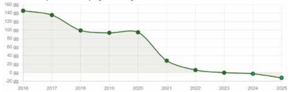
Indice di tempestività dei pagamenti (giorni): 2016 - 2025

Fonte: Rendiconti di gestione del Comune di Cormano