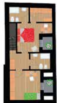
Pianta piano secondo