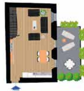
Pianta piano primo