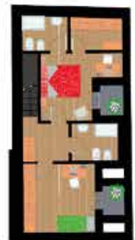
Pianta piano secondo