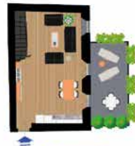
Pianta piano primo